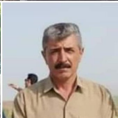
موختاری گوندی تووتەفەل و زاواکە ی که لە ۲۱ مانگی ئایار بە هۆی هێرشیکێ درۆنی تورکیا لە ناو ئۆتۆمبیلەکاندا ..شەهیدکران