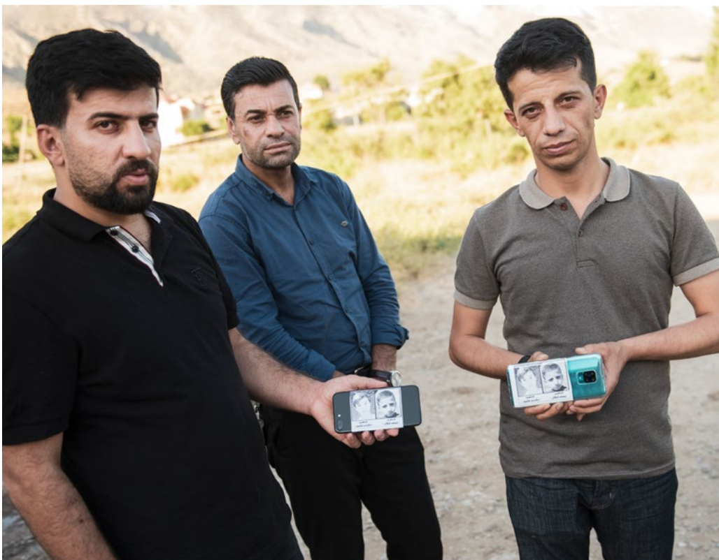
باوکی یوسف و ئافه ند که وینه ی کوره کانیان پیشانده دن که به هیرشی هاوه ن له بامه رنی شه هید کران.

ده کریت بگوتریت هیرشه سه ربازییه کانی سالی 2022سی سه ر جوتیار، ئاژه لداره کان و ئه وانه ی گژوگیایی به هاری/خۆرسک کۆ ده که نه وه په وتیکی گشتگیران ل نه دی ده کریت. له سالی 2015 تا وه کوو ئیسته، یه ک له سه ر سی هیرشه کانی سوپای تورکیا (33 هیرشی سه ربازی) خه لکی مه ده نییان به ئارمانج گرتووه له کاتی کیلانی زه وییه کانیان، ئاگا لیوون له ئاژه له کانیان یان کۆکردنه وه ی گژوگیایی به هاری/خۆرسک له سه ر چیاکان بۆ دابینکردنی بژیوی ژیا نییان. ئه و هیرشانه