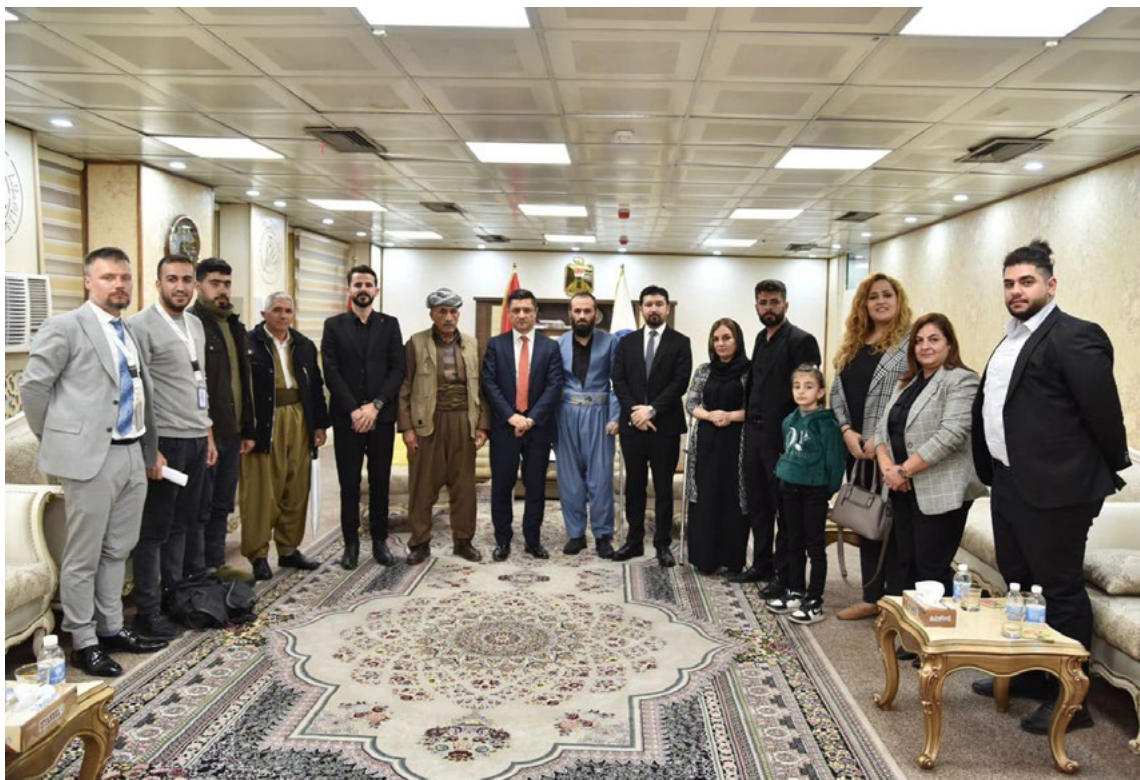
چاوپیکه‌وتنی شاندى كه‌مپینی کۆتایه‌په‌نانه‌ به‌ بۆردوومانه‌کانی سه‌ر سنوور له‌ گه‌ڵ وه‌زیری داد له‌ به‌رواری 2022/11/28

به‌دریژایی ساڵی 2022، ده‌وله‌تی ئێران چهند جاریک بۆردوومانی ناوچه‌کانی خاکی کوردستانی عێراقیان کرد. وه‌کوو ئه‌ندامانی کامپه‌ینی <<کۆتایی بینه‌ به‌ بۆردوومانه‌کانی سه‌ر سنوره‌کان>>، پیمان وایه‌ په‌یوه‌ندی هه‌یه‌ له‌نیوان خۆپیشاندا نه‌ سه‌رتاسه‌رییه‌کانی ئێران، که‌ ژنه‌ کورده‌کانی ئێران به‌شداری کارایان هه‌بوو له‌گه‌ڵ په‌لاماره‌ سه‌ربازییه‌کانی ده‌وله‌تی ئێران بۆ سه‌ر کوردستانی عێراق. به‌پێی به‌یاننامه‌یه‌کی سوپای پاسدارانی ده‌وله‌تی ئیسلامی ئێران، له‌ ساڵی 2022دا 73 موشه‌ک ئاراسته‌ی کوردستانی عێراق کراون له‌ خاکی ئێرانه‌وه‌، هه‌روه‌ها ده‌یان فرۆکه‌ی بێفرۆکه‌وانی خۆکوژ به‌کارهاتبوون بۆ به‌ ئارمانجگرته‌ی باره‌گای سه‌ره‌کی و بنکه‌ی دیکه‌ی سێ پارته‌ ئۆپۆزیسیۆنی کوردی ئێران به‌ ناوه‌کانی پارته‌ دیمۆکراتی کوردستانی ئێران (KDP-I) له‌ کۆیه‌ی پارێزگه‌ی هه‌ولێر، کۆمه‌له‌ له‌ «زړگوێزی»-ی پارێزگه‌ی سلیمانی و پارته‌ ئازادی کوردستان (PAK) له‌ «پردی»-ی سه‌ر سنووری نیوان پارێزگه‌کانی هه‌ولێر و که‌رکوک.